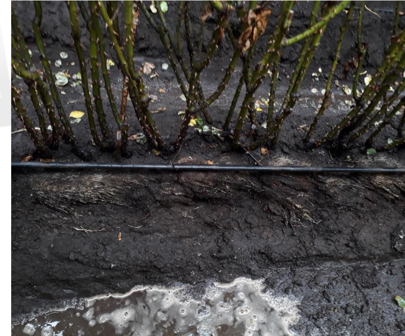
PROGRAMA MICROTECH - Semana 30 - 2019