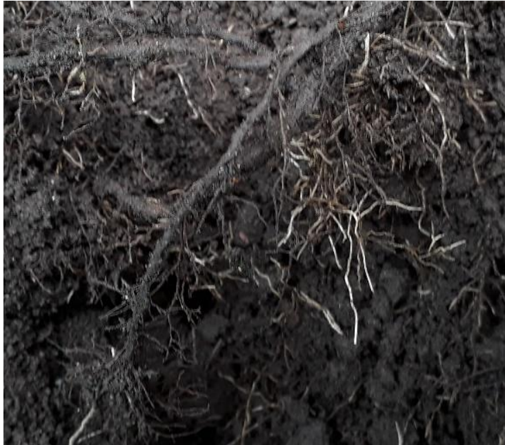
Antes de aplicar el programa – Semana 21 - 2019